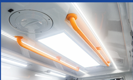
มือจับพลาสติกในลอน Anti-bacterial