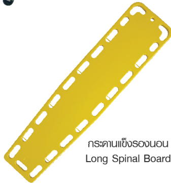
กระดานแข็งรอนอน Long Spinal Board