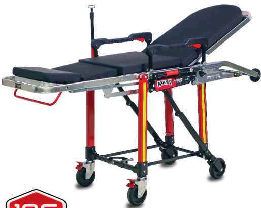
เตียงรพพยาบาล Stretcher Werk Pro 5

(ผ่านการทดสอบ มาตรฐาน EN-1789 10G แบบ Dynamic 10กน X+)