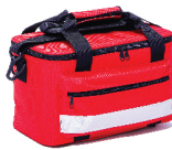
กระเป๋าปฐมพยาบาล First Aid Kits

(ผ่านการทดสอบ มาตรฐาน EN-1789 10G แบบ Dynamic 10กน X+)