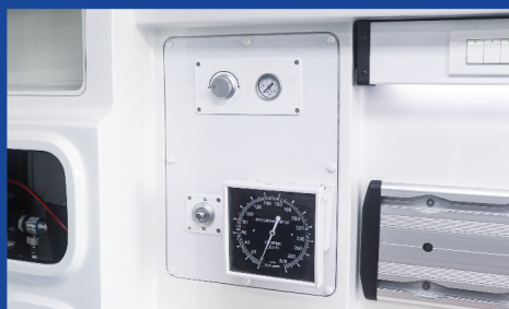
แผงควบคุมระบบออกซิเจน (แบบ Pipe Line)