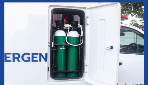
สะดวก สบาย กับ ประสิทธิภาพ load ถึง oxygen จากภายนอก